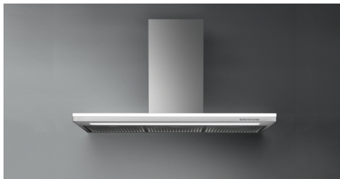
Das Bild dient rein einer groben Information. Es kann von der ausgewählten Version abweichen.