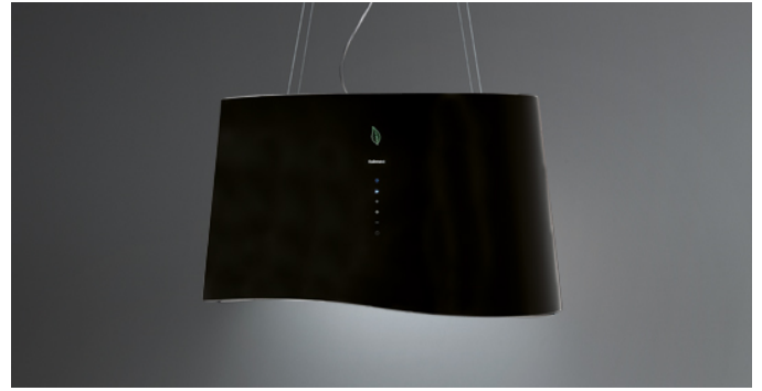
Das Bild dient rein einer groben Information. Es kann von der ausgewählten Version abweichen.